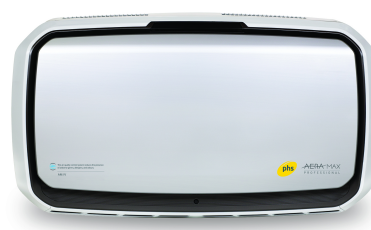
AeraMax Professional IV