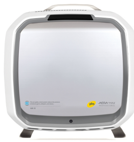
AeraMax Professional III

La solución perfecta para los espacios más pequeños: baños, despachos y salas de tutoría. Eficaz, eficiente y silencioso.