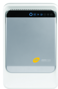
AeraMax Professional II

Por cada modelo de Aeramax Professional te obsequiamos con un regalo