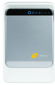
AeraMax Professional II

Ideal para estancias de hasta 30m2 Instalación: En pared y suelo (accesorio)