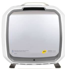
AeraMax Professional III